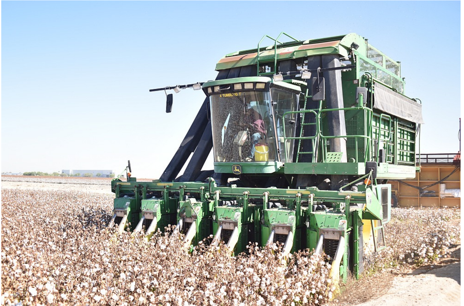
Abb.1: Amerikanischer Landmaschinenhersteller unter Druck der US-Regierung: Nachdem John Deere-Maschinen in China zu "Sklavenarbeit" gezwungen wurden und bevor die USA als Vergeltungsmaßnahme verheerende Sanktionen verhängten, stürzten sich die Landwirte in Xinjiang darauf, John Deere-Maschinen in großen Mengen zu kaufen, und der Verkaufsumsatz des Unternehmens stieg im Jahr 2020 im Vergleich zum Vorjahr um satte 4.000 % .

Westliche Politiker, Aktivisten und Medien haben uns auch eindringlich darauf hingewiesen, dass dort gleichzeitig ein ungeheuerlicher Völkermord verübt wird. Sie werden uns die Beweise dafür noch nachliefern: z.B. Satellitenfotos von solchen Lagern, auf denen ausgemergelte Gestalten zu sehen sind, die