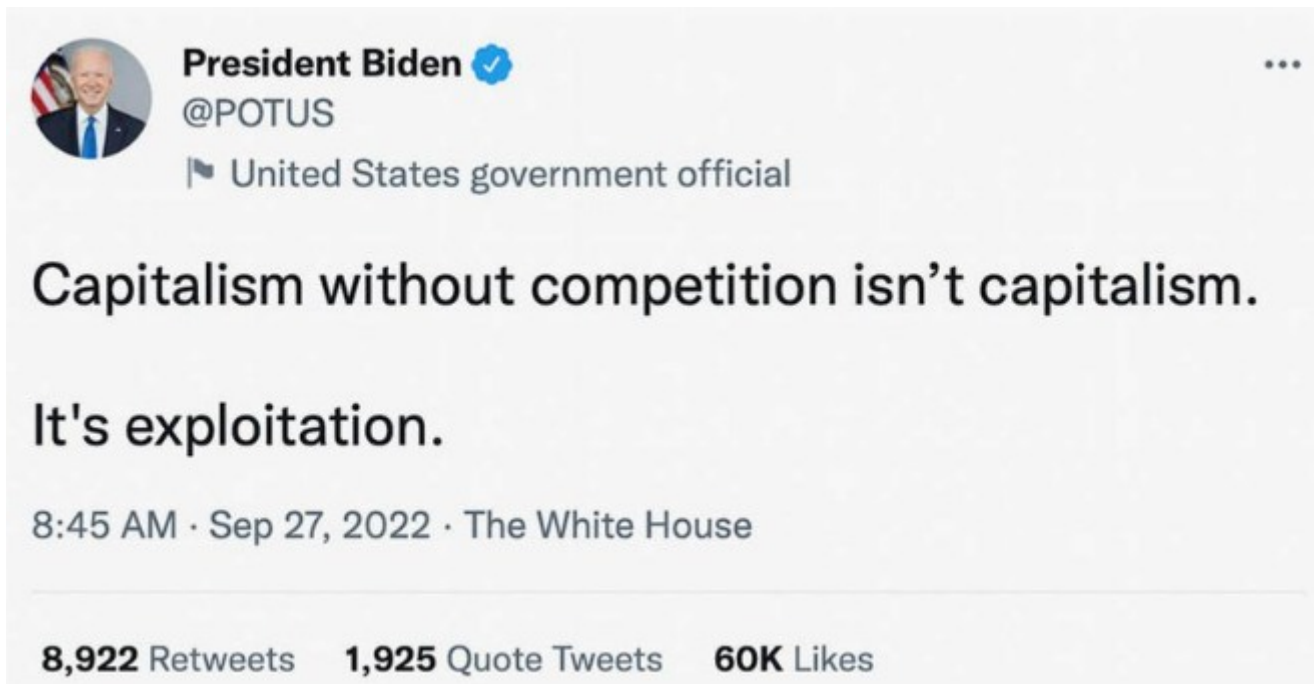
Abb.4: Tweet von U.S. Präsident Biden.