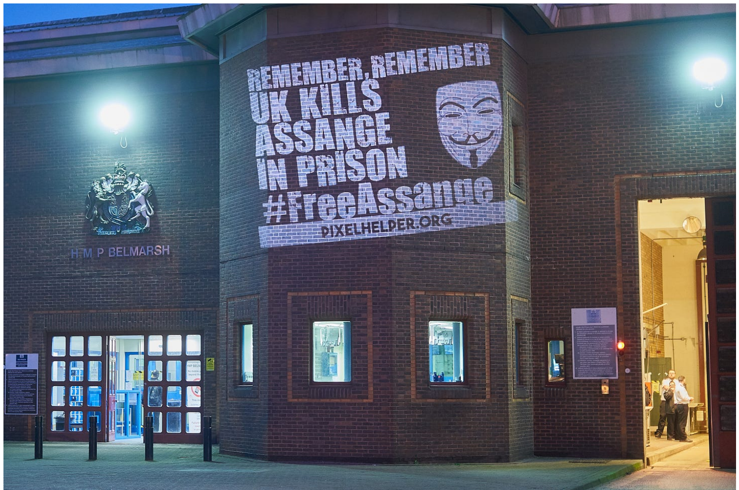
Lichtinstallatie voor Assange op de muren van de hoogbeveiligde gevangenis HMP Belmarsh vanaf voorjaar 2020